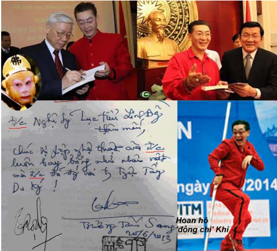
Các ông Nguyễn Phú Trọng –Trương Tấn Sang tiếp kiến “Vua Khí” màu đỏ.